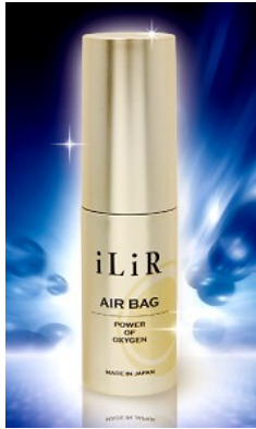
エアバッグ 15ml ￥12,600